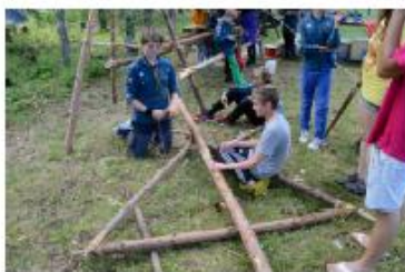
Har har de fullt upp med surrningen

Äventyrarna i lägret grip har börjat surra en karusell. Ja, en karusell! Jag tror att vi på redaktionen talar för fler när vi säger att vi är taggade!