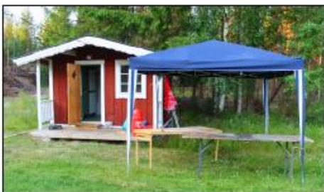
Öppetider Gottegården: Efter middagen