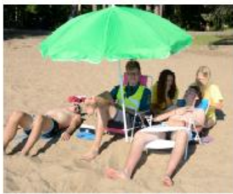
Livet som badvakt är hårt