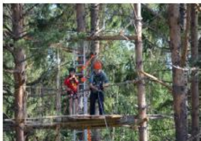
Linbanan har invigts