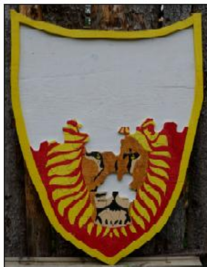
Har ser man att den biten med Aslans nos saknas

”Om de här scouterna inte är våra räddare så börjar jag tro att den där profetian kanske bara är en gammal skröna” säger den oroliga Herr Grävling.